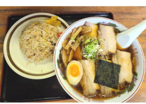
チャーシュー麺と炒飯セット

年齢が50歳を超え、子育てもひと段落。健康に気遣いながら残りの人生という風に過ごしていくか、死ぬまでにどういう人間になりたいのかなんてことを少し考え始めたりします。教養も欲しいですが、今から記憶力の落ちた人間がどこまで頑張っても、たかが知れています。それならば「人間性をあげたい」と思う様になりました。人柄が良い方が良いと決まっています。でも人間性をあげるってどういふことでしょうか。まずは、自分の感情をコントロールする必要があります。日々起る出来事に対して怒ったり、不満を言ったりし