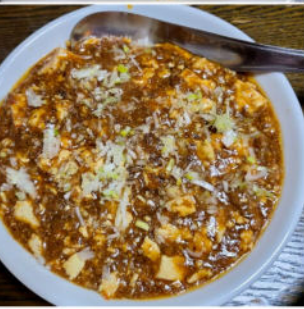
五目炒飯と麻婆豆腐

マスターは栗石プリンスホテルで15年程修行をして、2012年12月にお店をオープン。現在10年目、お店の名前は息子と娘さんの名前から1文字ずつ取ってつけたそうです。マスターにこだわりを聞くと「美味しい物を提供したい。お客様から料理に対して注文があれば、臨機応変に対応していきたい」と教えてくれました。