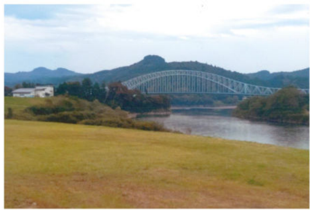
北上大橋が見えるこの川原は私にとって落ち着ける場所です

私は中学生の頃、親戚の棟梁（師匠）が仕事をしている姿を見ていた時に「どうだ。穴掘りをしてみるか」と言われ、ノミと玄能を借りて実際に作業を開始。「なかなか筋が良いから、中学を出たら私の弟子にならないか」と言われた事がきっかけで、中学卒業後その師匠に弟子入り。そこから本格的に大工を志しました。