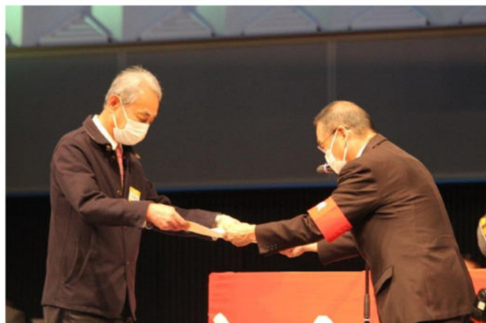
59人が全建総連の大会表彰を受ける

開催日時 12月8日(木) 13時受付 14時開会 会場 盛岡市 「ホテルニューカーリーナ」