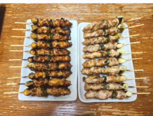
はさみ(ねぎま)の食べ比べ

現在までの45年間は、常に会社・自分・家族の為に社員として頑張ってきました。この事を踏まえて「私のこだわり」は何だろうかと改めて考えてみました。おそらくですが「長い物には巻かれる」と言う事が「私のこだわり」なのではないかと思えます。